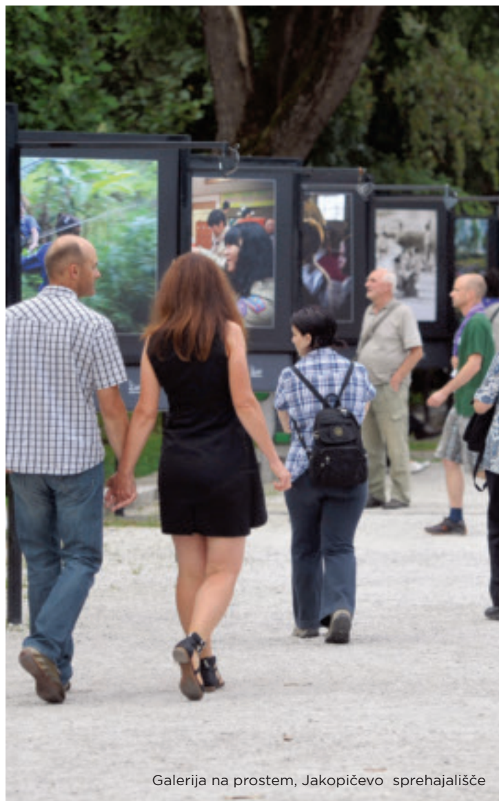
Galerija na prostem, Jakopičevo sprehajališče