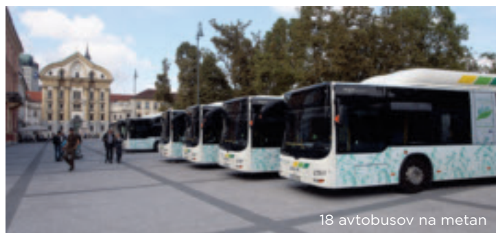
18 avtobusov na metan