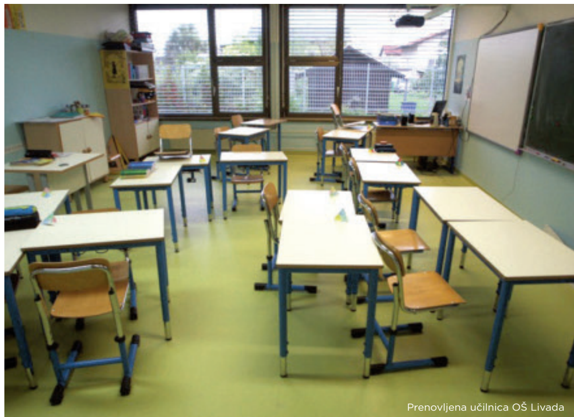
Prenovljena učilnica OŠ Livada