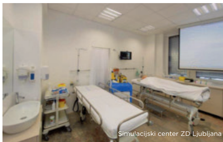
Simulacijski center ZD Ljubljana

Še naprej bomo sofinancirali programe javnega zdravja in socialnega varstva: programe za mlade, stare, populacijo LGBT, ljudi z oviranostmi, ljudi s težavami v duševnem zdravju, za ženske in otroke, ki so žrtve nasilja, za revne in tiste, ki se srečujejo s tveganjem za nastanek revščine, za ljudi s težavami zaradi uživanja dovoljenih in nedovoljenih drog. Z nadaljevanjem začetih aktivnosti bomo vzor evropskim mestom v dostopnosti za ljudi z oviranostmi in mesto enakosti spolov , dodatno bomo nadgradili medgeneracijsko sodelovanje in pomoč ter spodbujali socialno podjetništvo .