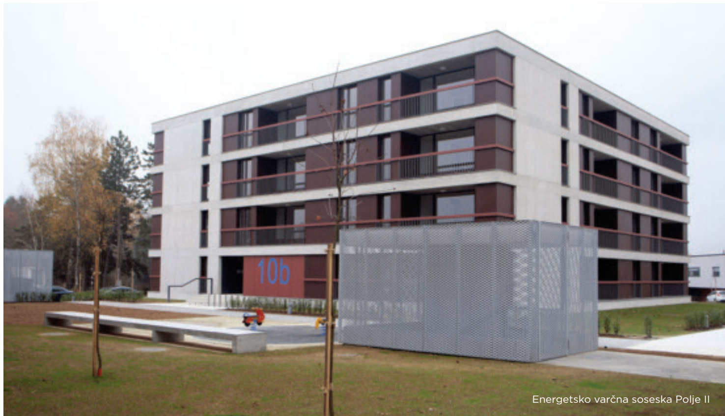
Energetske varčne soseske Polje II