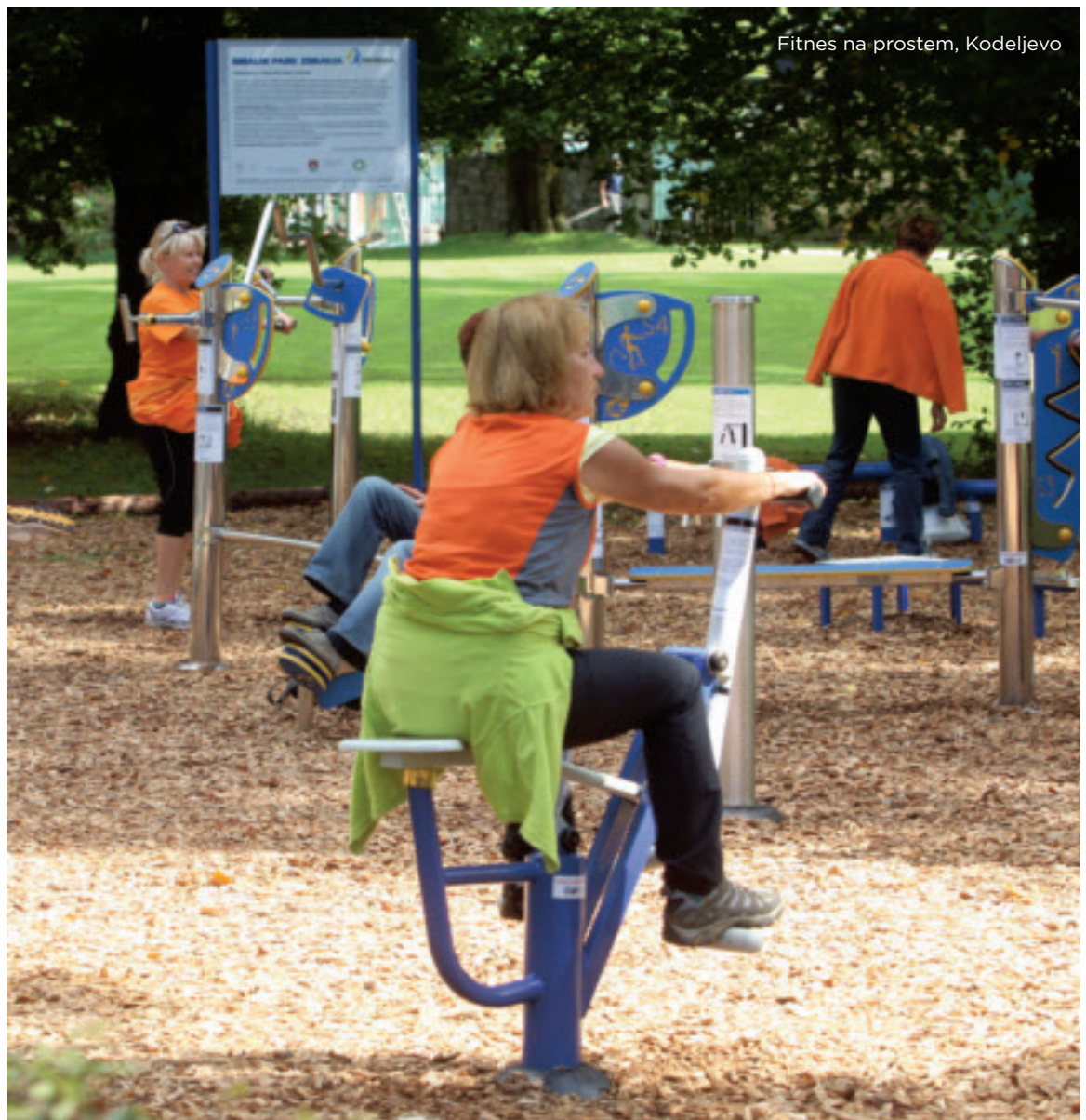
Fitnes na prostem, Kodeljevo